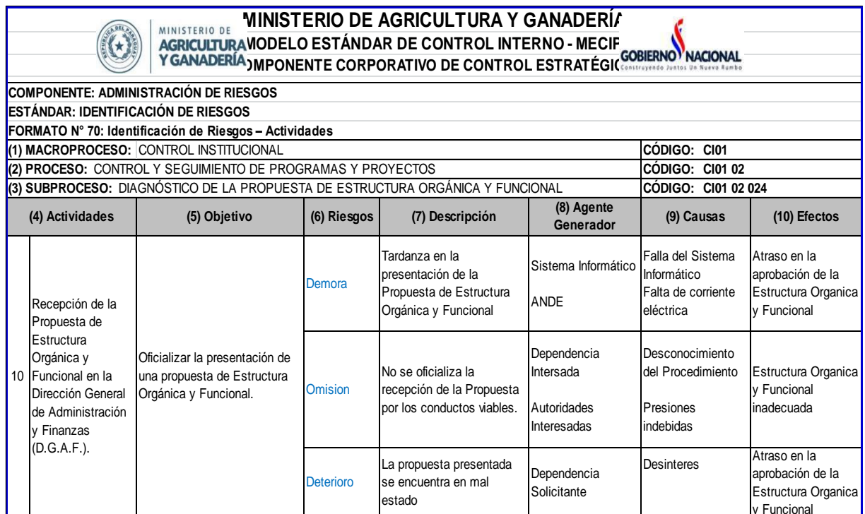
Figura N°2. Formato N°70 – MECIP

A continuación se detallan las descripciones del llenado del formato.